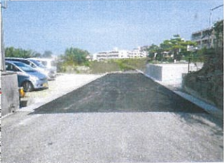
津嘉山1158番地周辺 工事完了