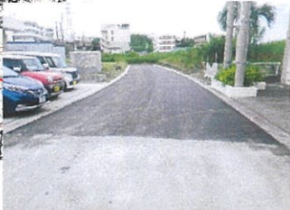
津嘉山1177番地周辺 工事完了