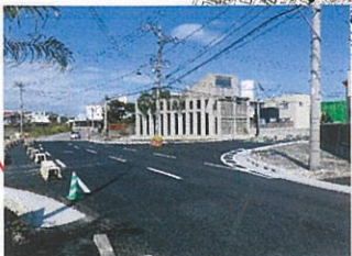
本部公園線 工事中