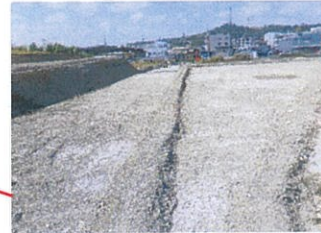
津嘉山486番地周辺 工事中