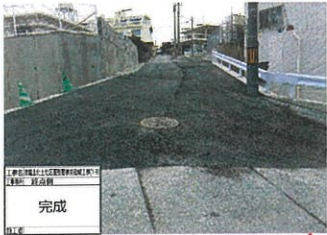
津嘉山1397番地周辺 工事完了