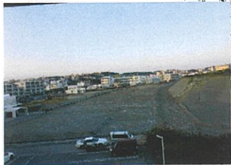
旧津嘉山ハイツ周辺 造成工事中