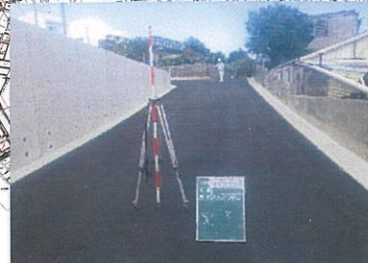
津嘉山484番地周辺 工事完了