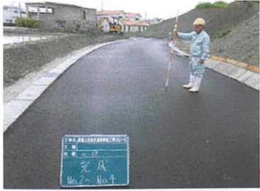
津嘉山1421番地周辺 工事完了