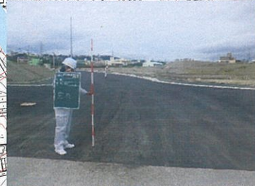
本部公園線 工事完了