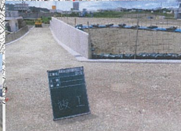
津嘉山480番地周辺 工事完了