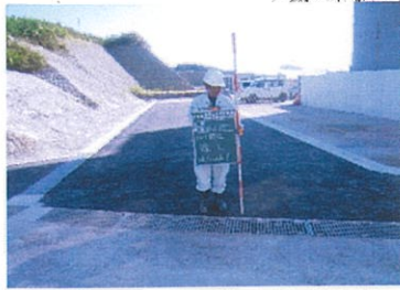
津嘉山1454番地周辺 工事完了