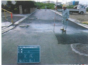
津嘉山1465番地周辺 工事完了