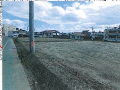
津嘉山558番地周辺 工事完了