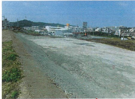
津嘉山490番地周辺 工事完了