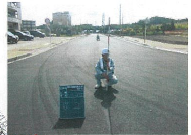
本部公園線 工事完了