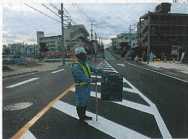
仲井真津嘉山線 工事完了