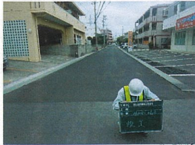
津嘉山サンエー通り 工事完了