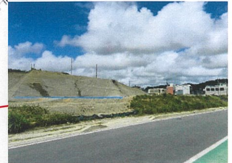
津嘉山553番地周辺 工事完了