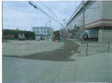
津嘉山サンエー通り 工事中