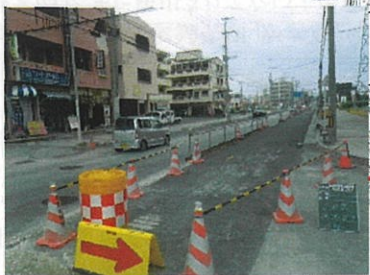
仲井真津嘉山線 工事中