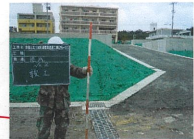
津嘉山427番地周辺 工事完了