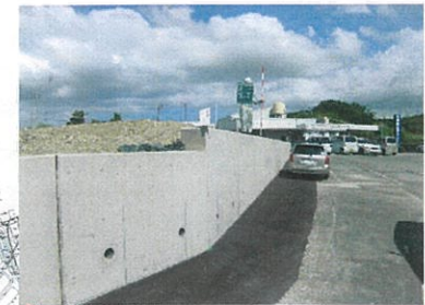
津嘉山296番地周辺 工事完了