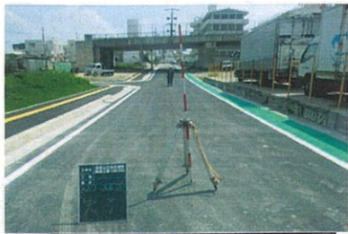
津嘉山1176番地周辺 工事完了