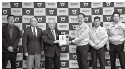
町商工会建設業部会 様より .....20万円