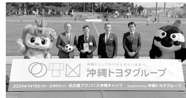
贈呈セレモニーの様子

名古屋グランパスによる地域貢献活動の一環として、キャンプ期間中の練習試合のゴール数1得点につき10球のサッカーボールを南風原町内の小中学校、スポーツ少年団に寄贈する企画を実施しています(沖縄トヨタグループ協賛)。 2018年より始まったこの企画では、これまで470球のサッカーボールを町内の子どもたちに贈呈しています。 今年はキャンペーン対象の練習試合にて合計8ゴールをあげ、80球のサッカーボールが子どもたちに贈呈されました。