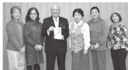
津嘉山ていがね一会 様より 古紙回収等で積み立てた基金等より贈呈 .....117,874円