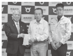
黒木の会 様より .....10万円