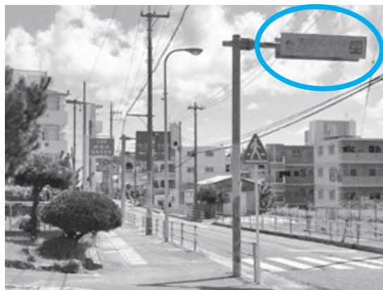
南星中学校前 学校表示

問 県道に接している、南星中正門前の学校表示の文字が消えている。県は撤去の予定と聞いた。新たに学校表示が必要と考えるがどうか。