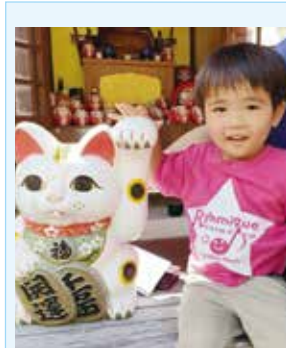
みんなに福が訪れますよーに☆