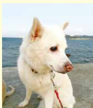
まだまだ長生きしてね。大好きだよー。