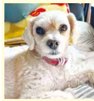
いつまでも元気に一緒に散歩に行こうね♪毎日癒やしをありがとう。大好きだよ。