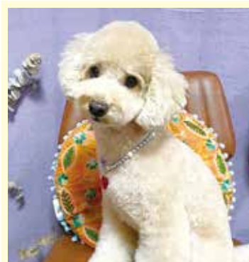
只今大ブレイク中 我が家の最推しアイドル。