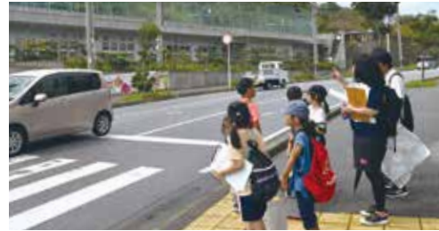
地図を確認しながら児童館から歩いて避難所となるちむぐる館へ移動する児童生徒

8月16日、兼城児童館と第一いこい学童の児童生徒が総合保健福祉防災センター(ちむぐる館)にて町の防災担当から防災について学びました。