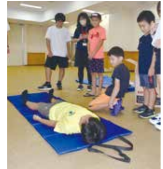
マットレスの上に実際に寝転がってみました。

兼城児童館といこい学童では4年ほど前から危険箇所や避難場所を確認して防災マップ作りを行っており、この日も兼城児童館の児童生徒は児童館から避難所となるちむぐる館までの道の危険箇所や設備を確認しながら、実際に歩いて訪れました。町の防災担当からは、「避難所では皆さんが過ごしやすく準備をしていますが、皆さんも日頃からそれぞれの家で災害への準備をすることで、家族を守ることができます」と教わっていました。