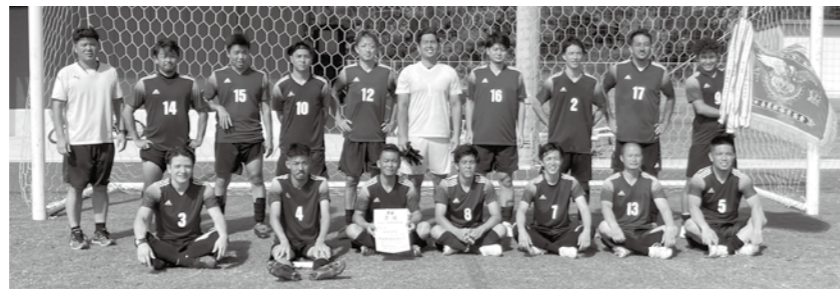
南風原町サッカー代表選手の皆さん

7月23日～9月24日の間、島尻郡体育大会(夏季大会)が開催されています。本大会で選抜された選手は、11月に県民体育大会へ出場となります。南風原町代表選手の応援、よろしくお願いします！