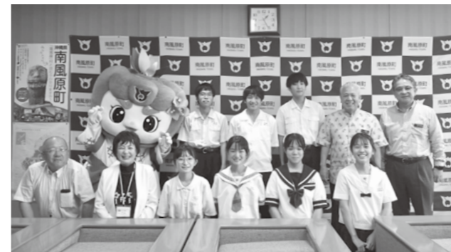
日向市の皆さんと町長、教育長、はえるん

現在の中学生たちの交流が、戦時中の学童疎開繋がりで結ばれた宮崎と沖縄の新たな歴史を作っています。