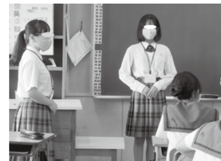
丁寧なお辞儀の実演をする高校生

キャリア学習に取り組んでいる2年生が、南部商業高校OA経理科3年生を講師に迎えてマナー講習会をしました。マナー講習に加え、南部商業高校の学校紹介も行い充実した学習となりました。