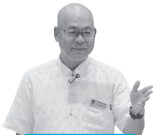
大城 雅史 議員