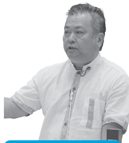
照屋 仁士 議員