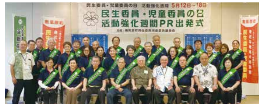
民生委員・児童委員のみなさんと町・町社会福祉協議会関係者のみなさん

5月12日(金)ちむぐる館にて、南風原町民生委員児童委員連合会主催 民生委員・児童委員の日 活動強化週間PR出発式が開催されました。