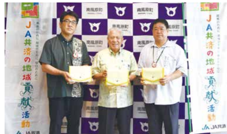
左から南風原支店仲里支店長・赤嶺町長・津嘉山支店城間支店長