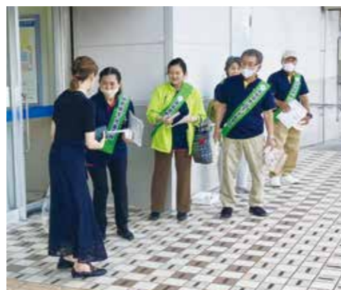
出発式後は、町内ショッピングモールでPR活動を行いました。