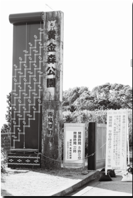
※黄金森公園の停電は1月15日に復旧しました。

答 工事代の他に、公園開園の間に必要な電力を得るため、発電機のレンタル代を計上している。