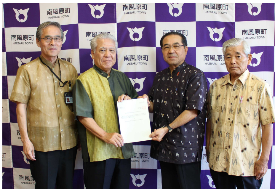
議長から町長へ要望書と報告書を提出