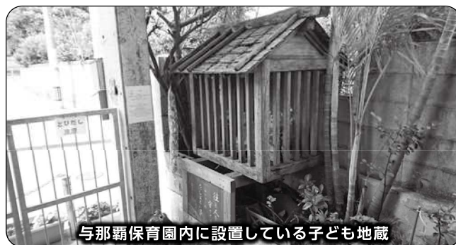
与那覇保育園内に設置している子ども地蔵

町長 私も事故当時の状況を覚えている。町交通安全協議会を前面に出して関わっていきたい。保全、建て替え、場所移設を関係者と協力して検討する