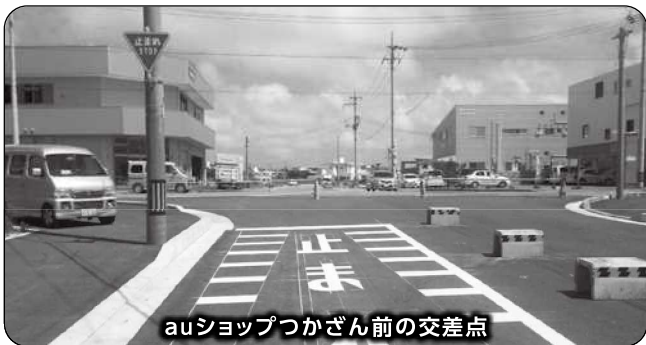
auショップつかざん前の交差点

町長 公安委員会に要請したが、今後の交差点の状況を見て検討するという回答があった。