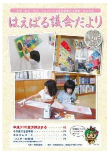
▲議会だより創刊205号