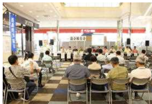
▲大型商業施設での議会報告会の様子

さらに、議会報告会后に意見交換会を行い、議会に対する意見や質問、町政に対する提言などを直接聴取する機会とします。