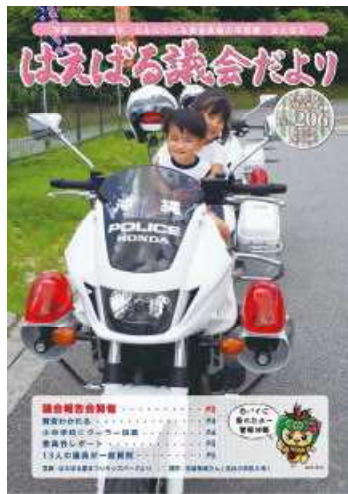
▲議会だより創刊206号