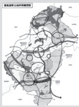
土地利用構想図全域にゆきわたるまちづくりを