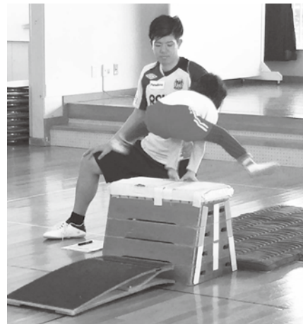
幼稚園体育活動充実事業の様子