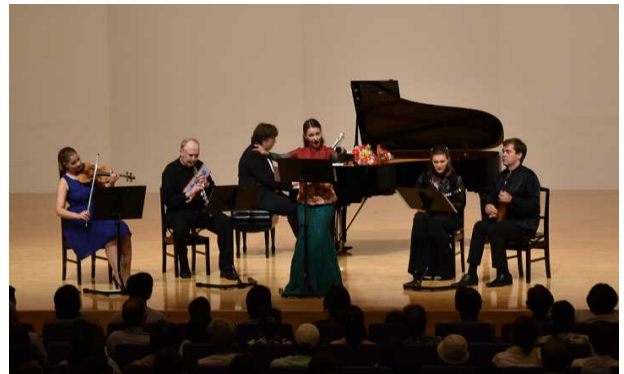
▲平成29年に南風原町で開催された日露交歓コンサートの様子(今年は南風原町で開催予定)