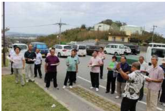
▲現場調査(予算の執行状況を現場を見て確認します)