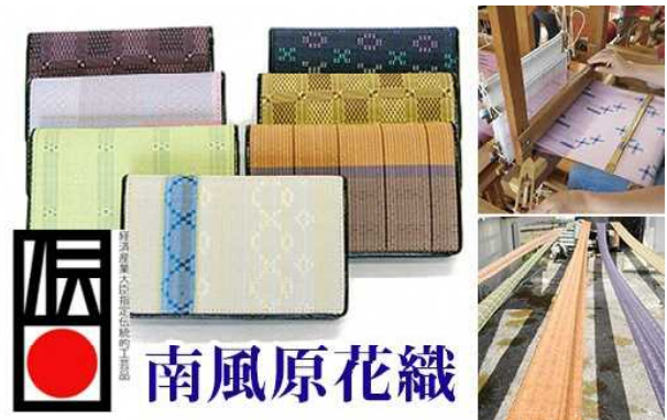
▲ふるさと納税による返礼品の一部(南風原花織名刺入れ)