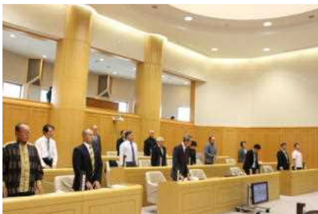
▲議会議場での採決