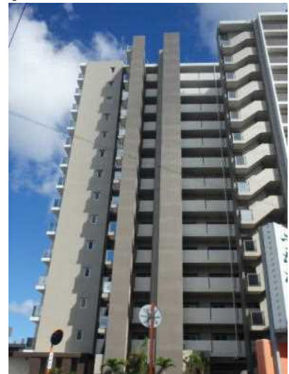
▲家屋(建物)を把握するため町内を巡回します。