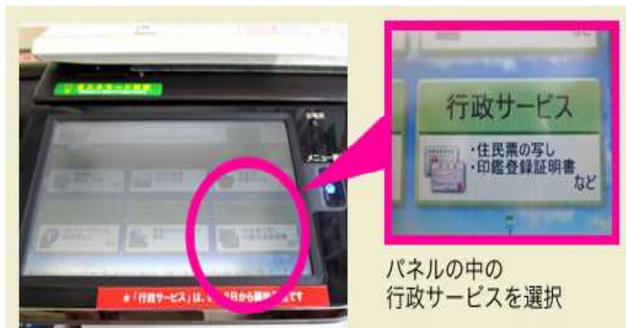
パネルの中の行政サービスを選択