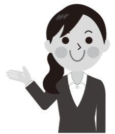
保険税納付指導員