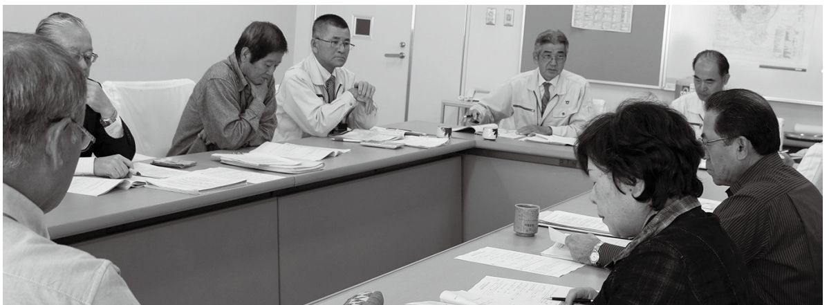
経済教育委員会審議中の様子。執行部の説明を受けています

問 登下校中のより道なども対象とするのか。 答 事案によって同委員会が個別に判断する。