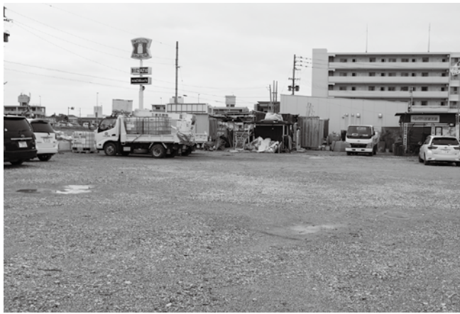
現場事務所として貸出しています