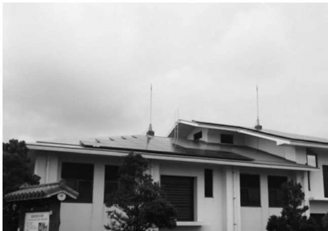
神里地区農業集落排水処理施設