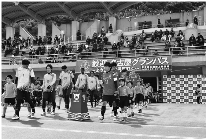
名古屋グランパスのキャンプ