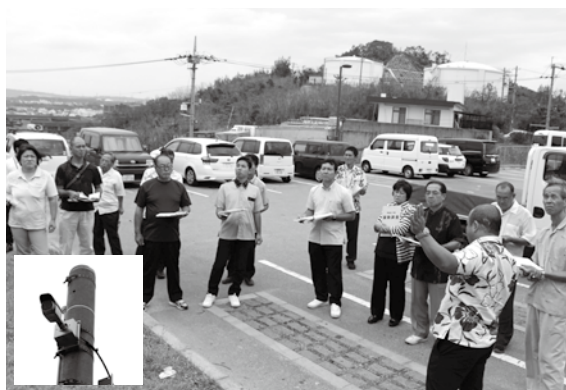
カメラは町内公園に合計11台設置されています

待機児童解消の為に新たな認可園として作られた字本部にある保育園です。定員は60名です。実際に、建物の中に入って各部屋、保育の様子等、確認しました。