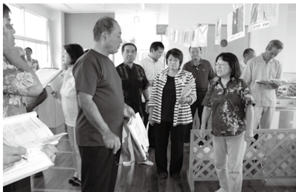
説明を聞きながら建物内を確認しました

決算審査のため、議員全員で現場を調査しました。町のお金が適正に利用されたか、直接見て確認しました。