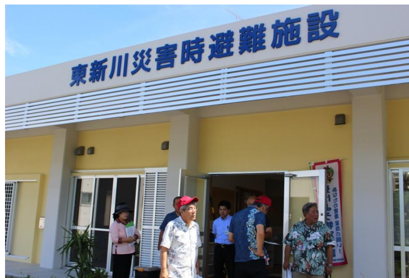
東新川災害時避難施設