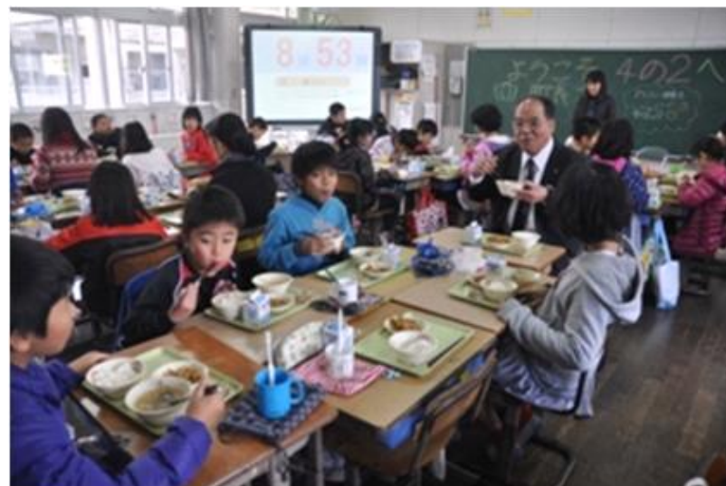
学校給食週間の給食交流