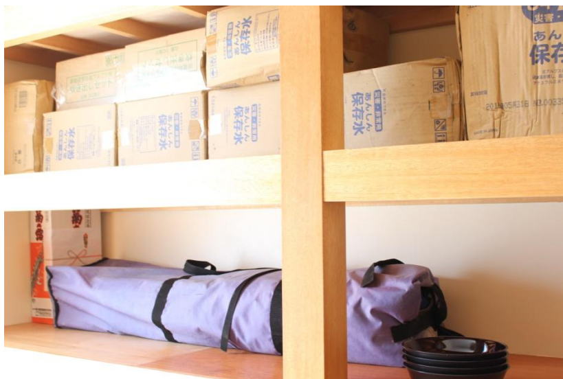
災害用備蓄品(水や食料等)