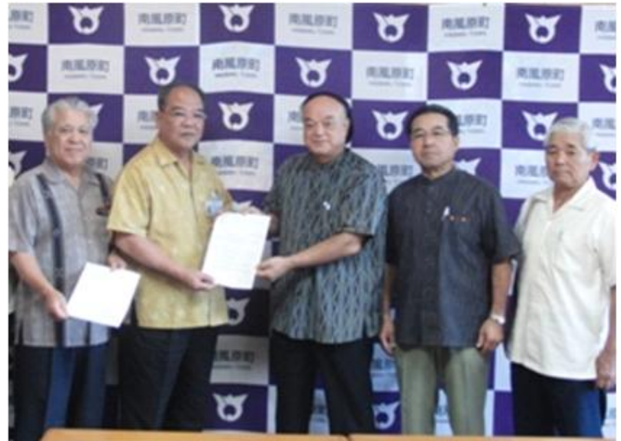
議長から町長へ要望書と報告書を提出

議会は5項目を重要な要望とし早急な対応を求めました。その他の質問・要望に対してもまとめて報告しました。