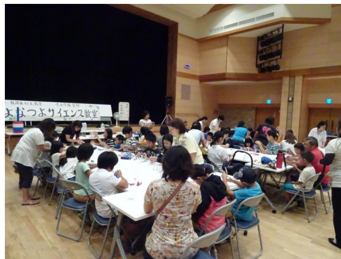
4校合同「サイエンス教室」