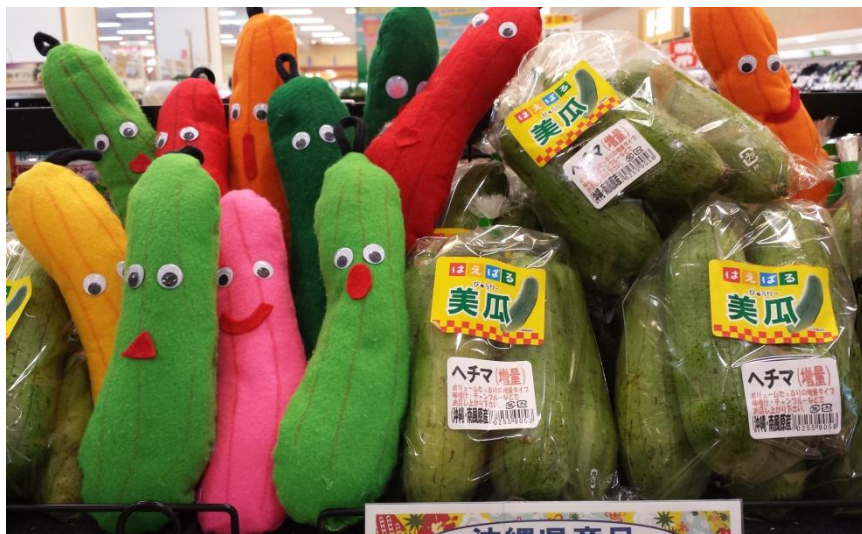
はえばる美瓜 (南風原町産へちま)

学校給食でJAを通して、へちまや冬瓜等を使用しています。今後もJAと連携し地産地消に取り組めます。