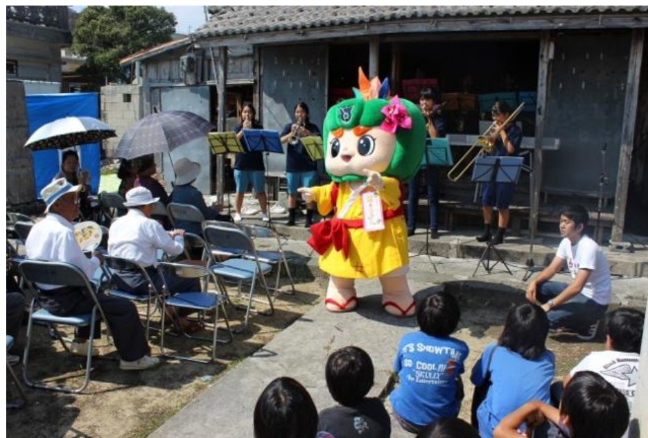
古民家チャンプルーフェスタ