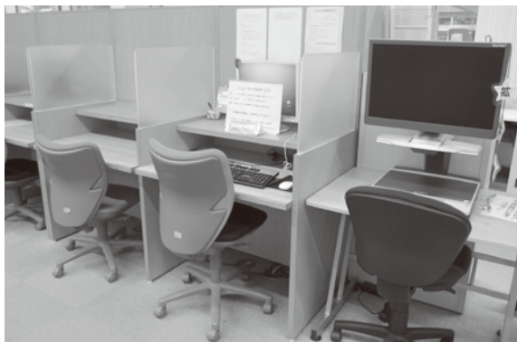
パソコン機器も設置されている。

答 平成25年度からDVD等の視聴覚資料の提供やパソコン機器の環境整備を行った。本土新聞も4紙に増やした。そのため、本の貸出以外の利用も増えている。