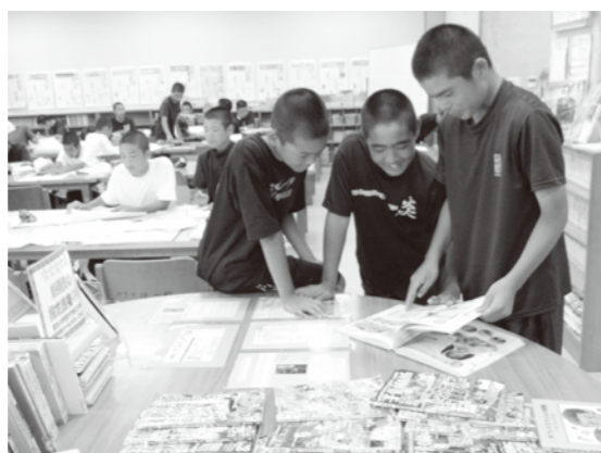
こども医療費は中学校まで無料となっている

問 窓口無料(現物給付方式)を実施できるように県の要綱改正を求めるべきではないか。