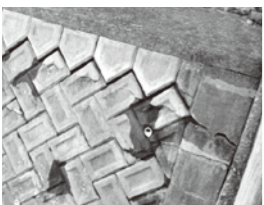
擁壁の亀裂が広がっている