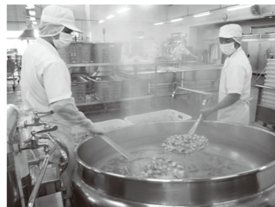
おいしい給食を日々作っています

教育長 現段階では無料化よりも次のことが重要である。 ・保護者負担をしっかりと守ってもらうこと ・徴収体制を整えて収納率の向上に努めること 給食費の支払いが困難な世帯には就学援助等の方法もあるため、十分周知したい。