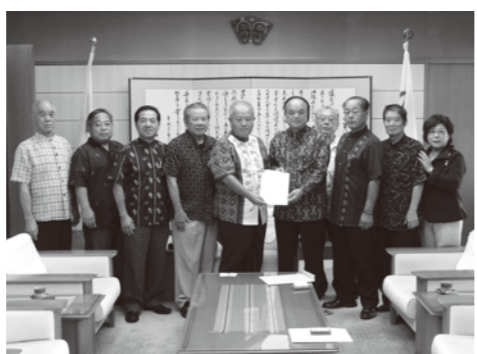
喜納県議会議長に要請決議を提出しました

10月20日に議長と経済教育委員会は沖縄県知事、県議会議長へ要請書を直接提出しました。