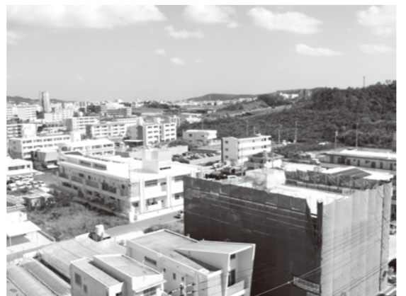
津嘉山区は年々人口が増え続けている

問 自治会には加入率の問題がある。新住民に対し、住民異動等の窓口で手続きの際、自治会加入の指導ができないか。