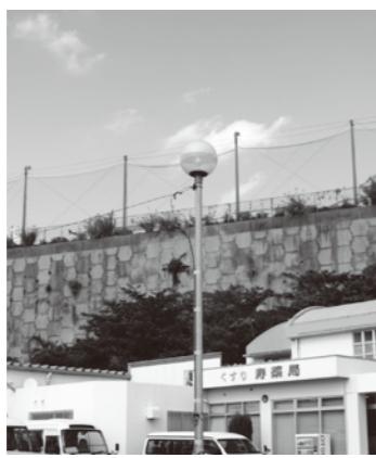
北丘小学校運動場南側の擁壁

教育長 新川側法面は平成26年度に法面調査を行う。27年度の設計で地震対策を検討する。擁壁調査は行っていない。必要に応じて対応したい。