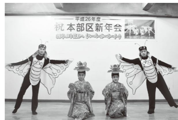
63年ぶりに復活したハーペールモーイー (本部)