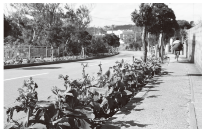
本部公園前はカンナの花で溢れている

副町長 他の町道にもカンナの花の普及を図っている。そのため、指定された町道のみカンナの花通りの愛称を付けることが妥当か検討が必要となる。愛称が決まれば立て看板の設置も可能と考える。