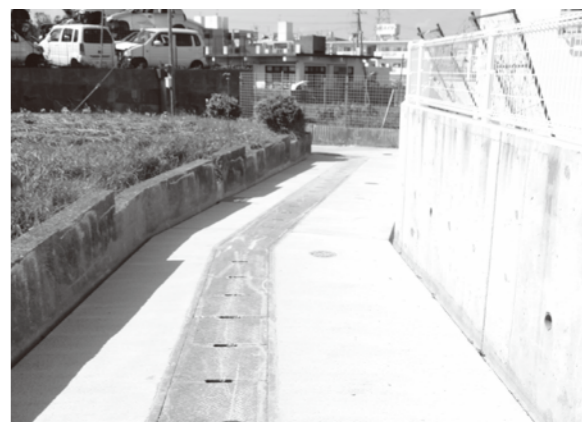
質問の箇所はその後整備された

副町長 1〜34番地付近と95〜101番地付近の2区域を平成27年度に整備する予定がある。