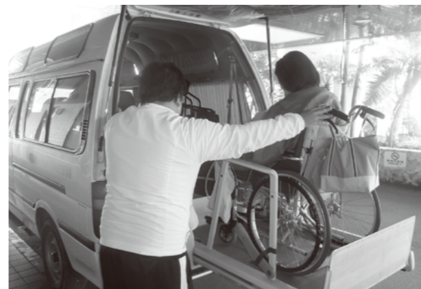
町社協の外出支援サービス

副町長 外出支援サービスや移動支援事業は対象要件があるため利用できない場合もある。今後どのような支援ができるか検討したい。