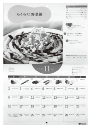
健康レシピカレンダー

副町長 普及啓発として町民への健康レシピカレンダーの配布、交差点などの横断幕掲示、チラシ配布、ポスターの掲示、食の講演会、説明会の開催などに取り組んでいる。