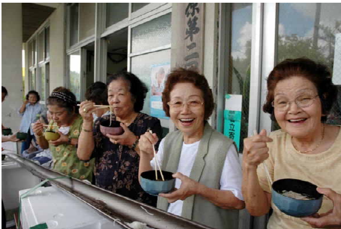
そうめん流しを楽しむ第2団地「さわやかなの会」の皆さん