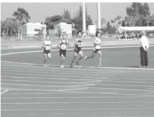
島尻郡陸上競技大会

答 島尻陸上や各種団体の大会等で減免が必要な場合は、申請書に基づいて免除となる。