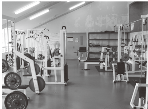
陸上競技場のトレーニング室が新しくなります