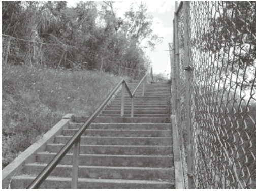
北丘小学校の新川階段を整備します

北丘小学校は築30年以上経過し、通路や擁壁に亀裂などを起こしています。避難通路、通学路として安全に活用するため西側集落の避難通路を整備します。