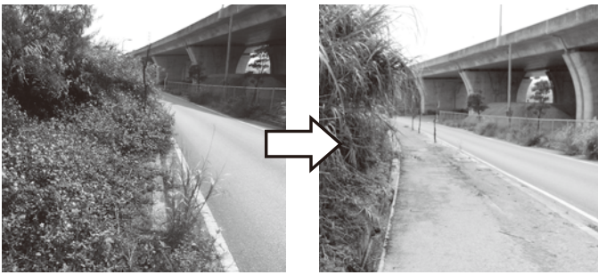
南インター付近 (整備前)

副町長 道路管理者である南部国道事務所に改善に向けて要請を3月10日に行っている。