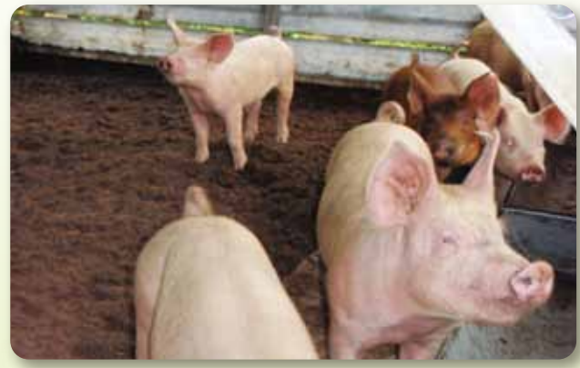
木くずの上でのびのび育つ「はえばる豚」

*はえばる豚のお肉は「はえばるエコセンター」(JAおきなわ南風原町役場支店隣)で購入できます。