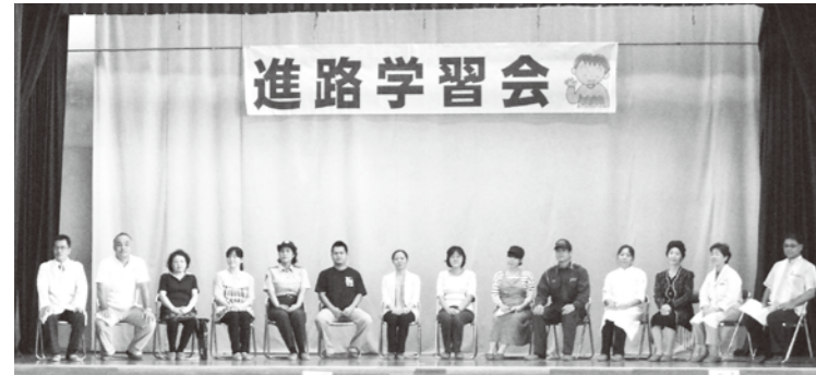
北丘小では14種類の職業を招いて