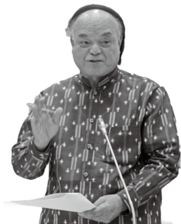
宮城 清政 議員