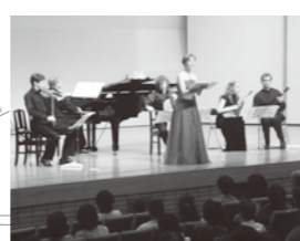
昨年開催されたコンサートの様子

企画財政課 ☎889-0187 中央公民館 ☎889-0568 南部広域市町村圏事務組合 ☎863-8213