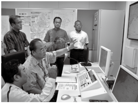
災害時には防災行政無線のスピーカーから町内全域に注意を呼びかけます。