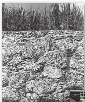
穴埋めされた石積み