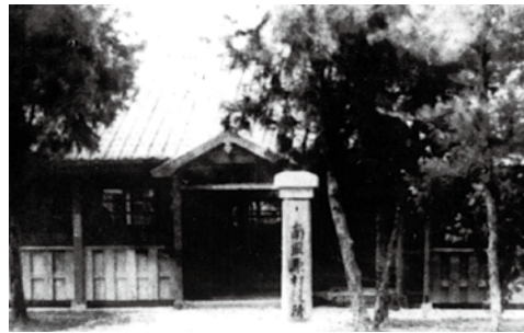
当時の南風原村役所